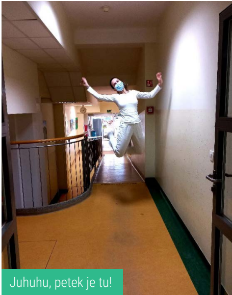
Juhuhu, petek je tu!