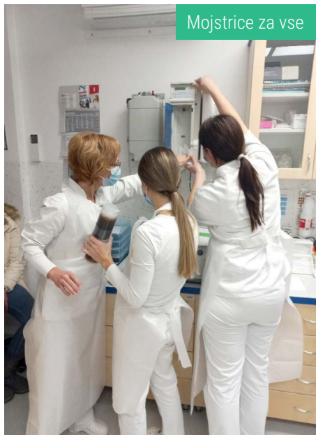
Mojstrice za vse