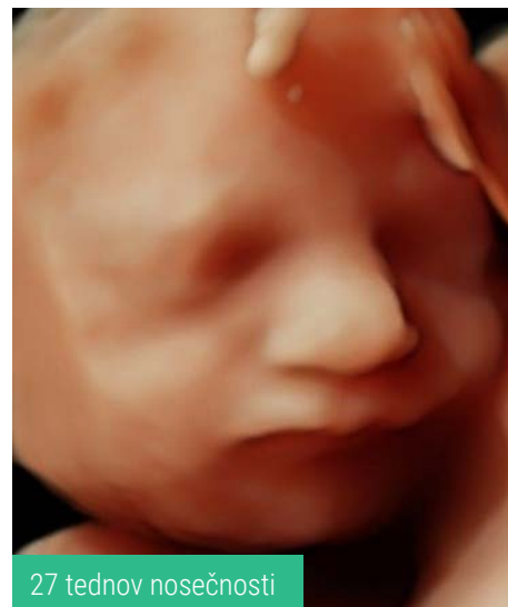
27 tednov nosečnosti

Tridimenzionalno (3D) in štiridimenzionalno (4D) ultrazvočno preiskavo ploda največkrat opravimo na željo staršev z namenom opazovati svojega še nerojenega otroka. Kakovost preiskave je odvisna od lege ploda, količine plodovnice in konstitucije nosečnice. Najboljši čas za preiskavo je med 26. in 28. tednom nosečnosti, sicer pa lahko preiskavo opravimo kadar koli v nosečnosti. 3D ultrazvočna sonda omogoča prikaz ploda v tridimenzionalni obliki, tako lahko pridobimo realističen posnetek obraza, ki je primerljiv s fotografijo. 4D ultrazvočna sonda pa omogoča ogled ploda v gibanju ter opazovanje izrazne mimike obraza. Opazujemo lahko nasmeh, odpiranje ust, zehanje, kremžanje, sesanje palca, požiranje ... Z opazovanjem otroka je omogočena medsebojna čustvena navezava bodočih staršev na otroka že pred samim rojstvom.