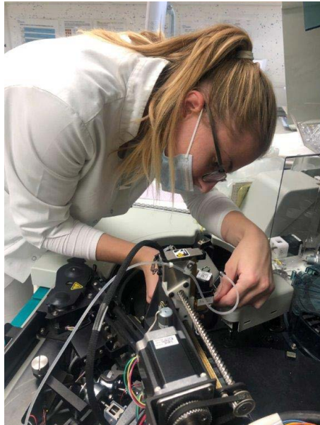
V pričakovanju prenove