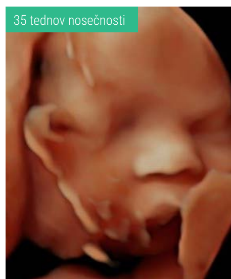
35 tednov nosečnosti