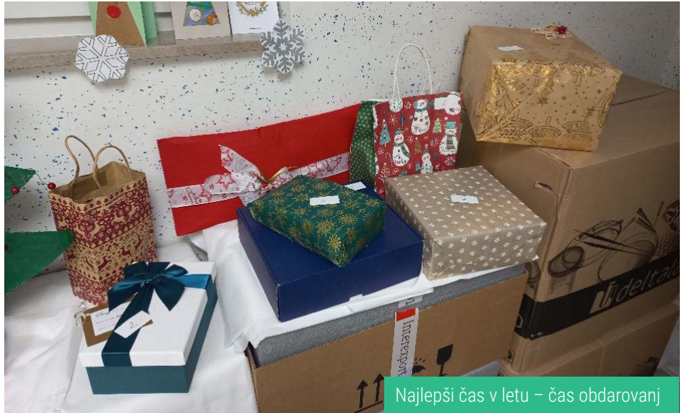
Najlepši čas v letu – čas obdarovanj