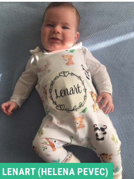
LENART (HELENA PEVEC)